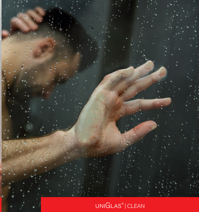
UNI GLAS ® | CLEAN

Trotz regelmäßiger Reinigung verliert das Glas von Ganzglasduschen, Duschwänden und Duschkabinen mit der Zeit seine Brillanz. Kleine milchige, raue Stellen entstehen auf der Glasoberfläche, wo sich bevorzugt Kalk, Schmutz und gesundheitsgefährdender Schimmel anlagert.