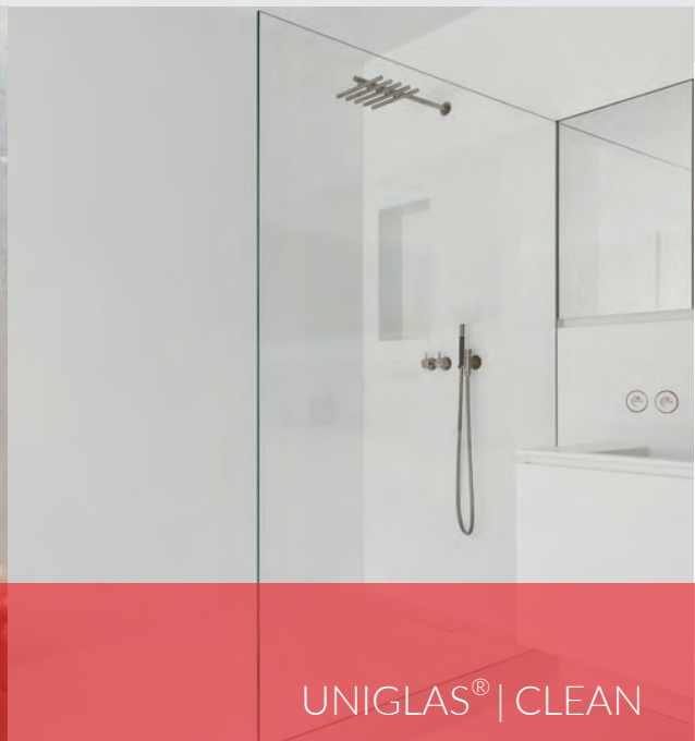
UNIGLAS® | CLEAN

Trotz regelmäßiger Reinigung verliert das Glas von Ganzglasduschen, Duschwänden und Duschkabinen mit der Zeit seine Brillanz. Kleine milchige, raue Stellen entstehen auf der Glasoberfläche, wo sich bevorzugt Kalk, Schmutz und gesundheitsgefährdender Schimmel anlagern können.