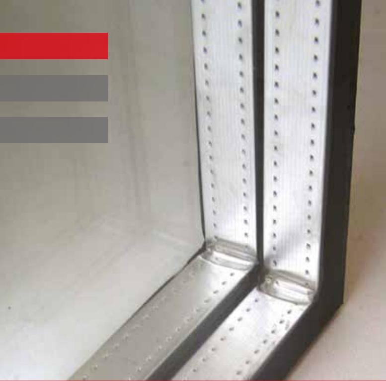
HERKÖMMLICHER ALUMINIUM- ABSTANDHALTER